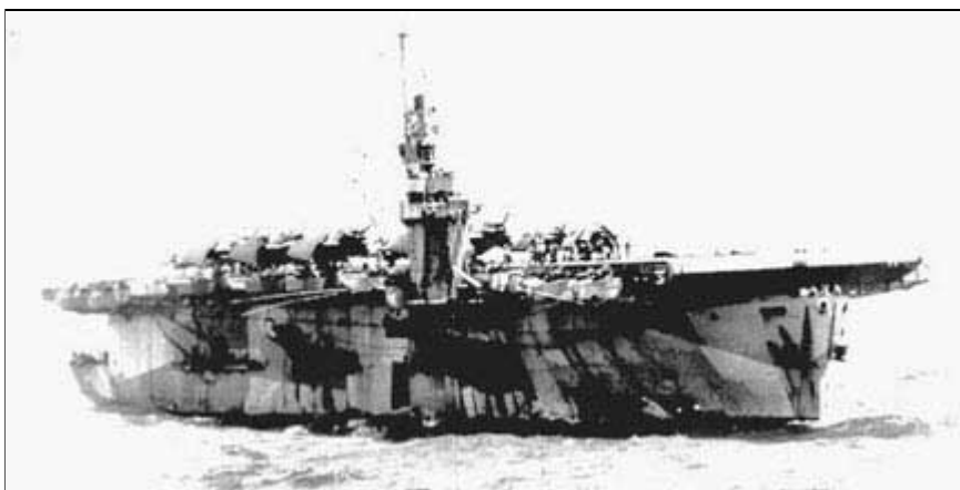
USS Natoma Bay